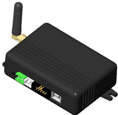
Универсальный контроллер УНИКОН